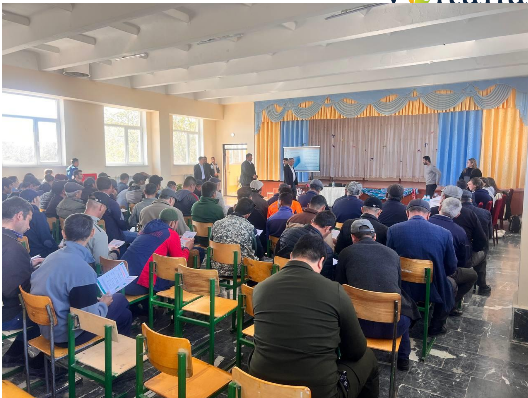
3-Расм: 2023 йил 9 ноябрда Саримайда бўлиб ўтган жамоатчилик билан бўлиб ўтган учрашувдан олинган фотосуратлар.

Ушбу тадбир давомида WSP ва ЕРТБ лойиҳа таассуротлари, кутилаётган таъсирлар, ҳар қандай ташвишлар, минтақадаги олдинги лойиҳалардан олинган сабоқлар, ҳудуддаги бошқа лойиҳалар амалга оширилиши ва ишчилар оқими натижасида юзага келадиган шикоятлар ҳақида эшитиш учун иккала ҳамжамият ва мактаб директори билан қисқа шахсий учрашув ўтказиш имконига эга бўлди. Улар аҳоли саломатлиги ва хавфсизлиги, экология, турмуш шароити ёки кўчирилиш жиҳатларига оид ҳеч қандай шикоят, танқид ёки хавотир билдиришмади. Уларнинг асосий ташвиши лойиҳа билан боғлиқ ишга жойлашиш имкониятлари билан боғлиқ эди. Маҳалланинг айтишича, маҳалла аъзолари ҳар куни ўз офисларига келиб, лойиҳа билан боғлиқ ишга жойлашиш имкониятларини билиб олишади. Кейин улар ишга жойлашиш имкониятига қизиққан номзодлар рўйхатини тузишни бошлаганликларини, бироқ шаҳар аҳолисининг кўпчилиги, жумладан, аёллар ва ёш авлод вакилларини қамраб олиш зарурлигини тушуниб, бу ғоядан воз кечишди.