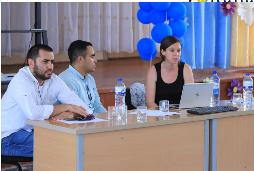
2-Расм: 2023 йил 7 июнда Саримайда бўлиб ўтган жамоатчилик билан учрашувдан олинган фотосуратлар .