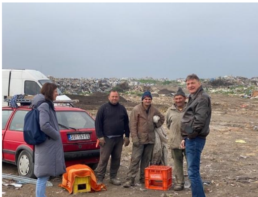
Депонија у Сомбору