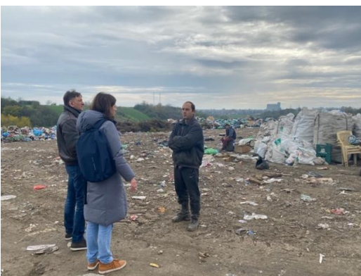
Депонија Црвенка (општина Кула)