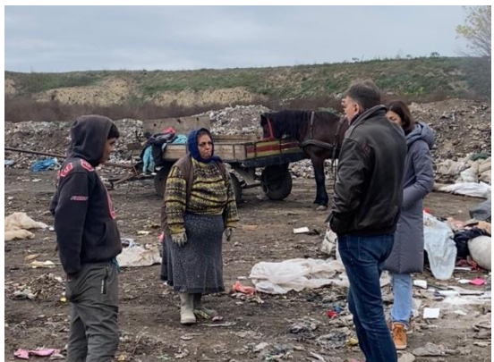
Депонија Сивац (општина Кула)