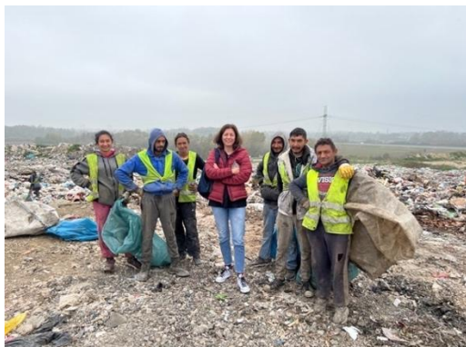
Депонија у Обреновицу