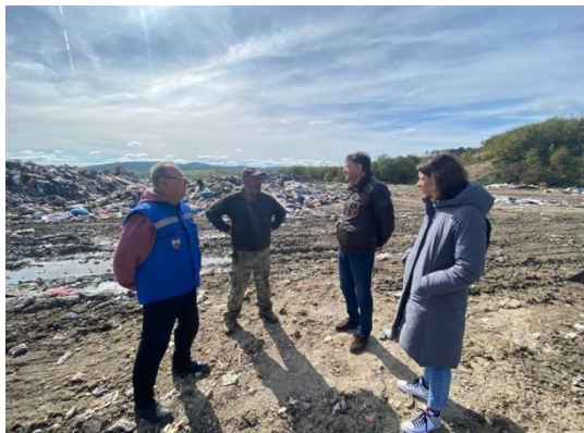
Депонија у Сјеници