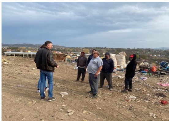
Депонија у Ваљеву